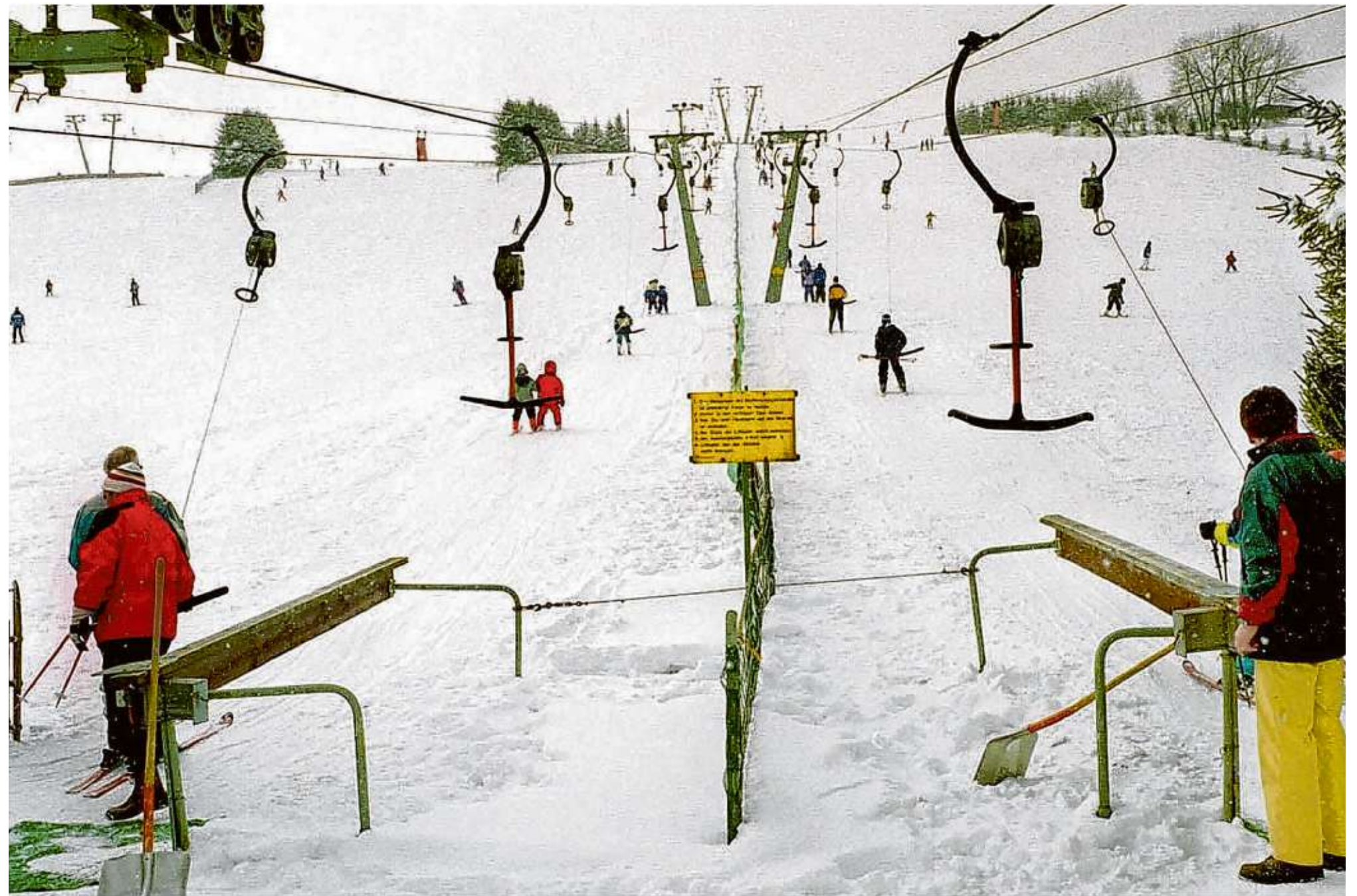
Saison 2001 in Westerheim: Damals waren die Skilifte noch regelmäßig in Betrieb. Das ist mittlerweile anders.